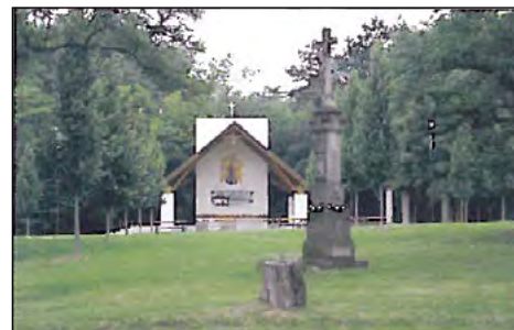
Poutní místo Svatý Antonínek

Ducha, zastavení při řece Moravě u plavebního kanálu, druhé zastavení při řece Moravě, Kostelany, Kunovický les, Ostrožská jezera, Ostrožská Nová Ves, zastavení v polích v údolí mezi Ostrožskou Novou Vsí a Ostrožskou Lhotou, Ostrožská Lhota, Svatý Antonínek). V rámci projektu bude vydán průvodce vytvořený PhDr. Josefem Palou s vloženou skládací