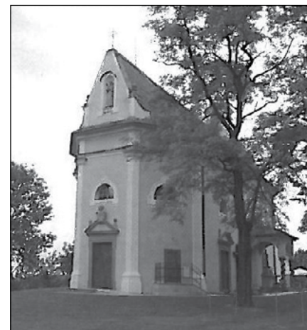
Poutní místo Svatý Antonínek